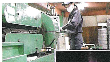
工場での業務風景

若手が積極性を発揮できる背景には、社内風土もある。「上から叱る」ことはなく、意見を出しやすい環境にしている。コロナ禍で飲み会ができず意思疎通を